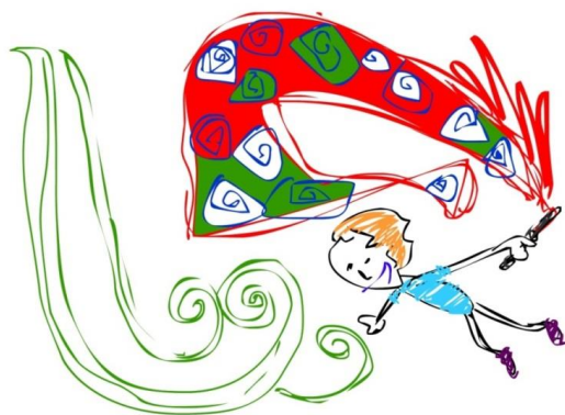
Imagem 2 – Alegres brincadeiras (Fonte: Desenhos autorais de Marcelo V. C. Amorim).

Na obra de Manoel de Barros, conforme Carpinejar (2001), há uma exuberância das inutilidades ou daquilo que não tem serventia, como ossos, latas, barbantes, sabugos, coisinhas do mato e do chão. O poeta escolhe o entulho, o traste, as sobras, as coisas imprestáveis, as miudezas, os pormenores, produzindo luxo a partir do lixo. “O que é bom para o lixo é bom para a poesia” (BARROS, 1990, p. 180, apud CARPINEJAR, 2001, p. 28).