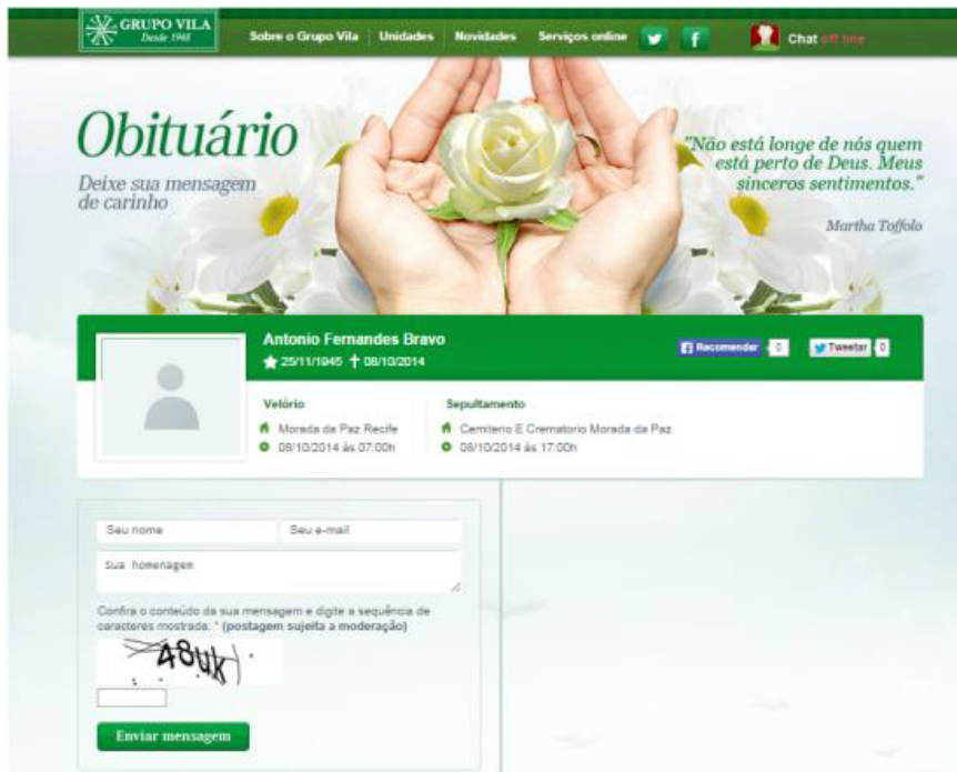
Figura 4: Página do morto para recados à família