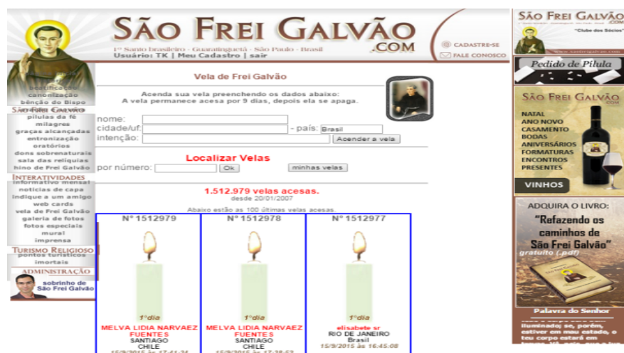
Figura 2: Como acender uma vela virtual no site

Descrição do site: O site oferece além das informações sobre o religioso, também é possível aos fiéis um espaço de interatividades como: indique a um amigo, web cards, palavra de Jesus, galeria de fotos, pílula da fé, vela de Frei Galvão, rádio Web com músicas católicas, entre outras. A vela virtual de frei Galvão permite que após um breve cadastro, o usuário, acenda uma vela virtualmente e o site fornece ao usuário um número para que o fiel possa acompanhar a vela acesa. A vela permanece acesa por nove dias, depois ela se apaga. O site é mantido pelo sobrinho de Frei Galvão.