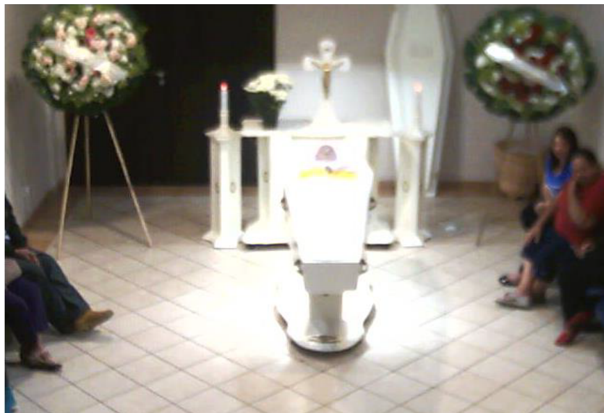
Figura 5: Transmissão em tempo real do velório