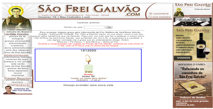
Figura 3: Acompanhamento da vela virtual no site

VELÓRIO VIRTUAL ( http://www.grupovila.com.br/velorio-virtual )